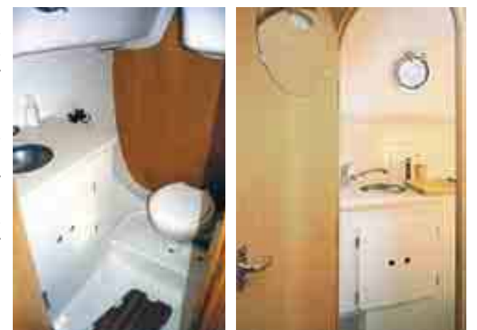
In alto la dinette con i due divani contrapposti, alzando le spalliere si ottengono due comodi letti. Sotto due immagini del bagno anch'esso molto rifinito