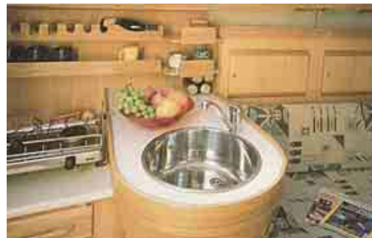
In alto le scalette d'entrata, si nota la rifinitura della falegnameria, inusuale per barche di queste dimensioni. Di fianco la cucina con l'isola per il lavello e il frigorifero